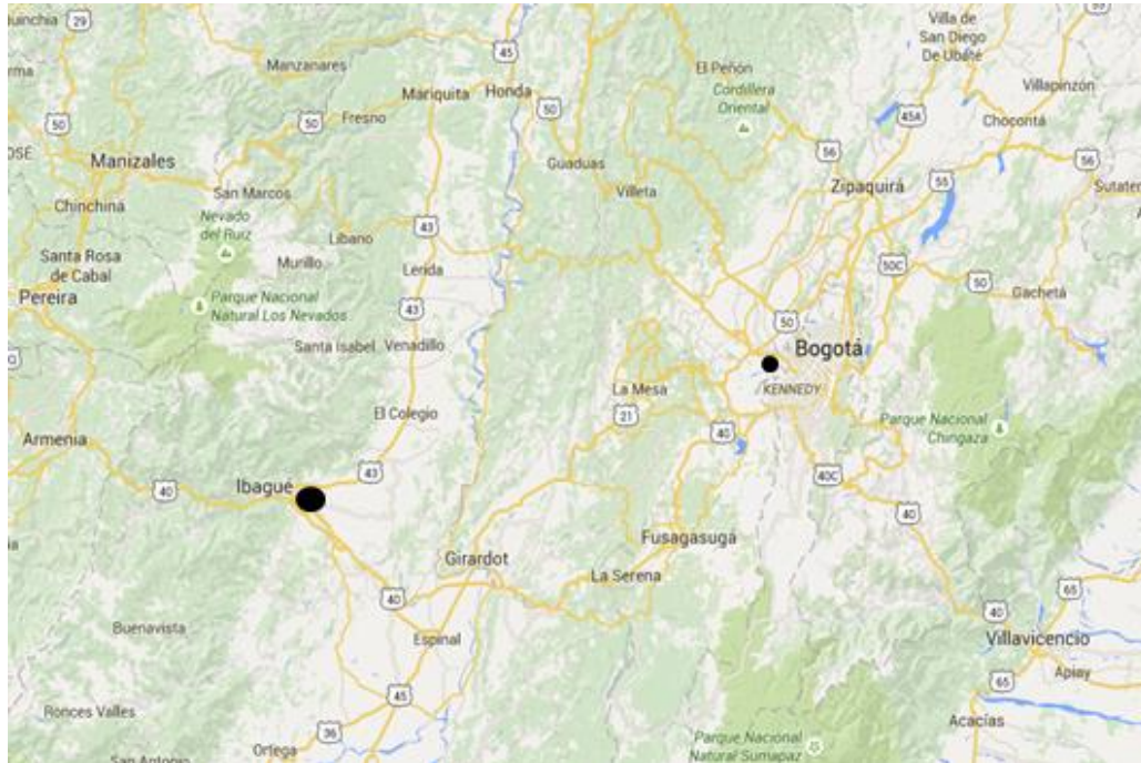
Figura 1. Localización Municipio de Ibagué – Tolima.

El proyecto se encuentra ubicado en la ciudad de Ibagué capital del Departamento del Tolima, localizada a 210 kilómetros al occidente de Bogotá (Capital colombiana), sobre una terraza inclinada, que hace parte de uno de los contrafuertes de la Cordillera Central.